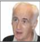
سید سید علی خامنه‌ای در جریان دیدار با رهبر ایران